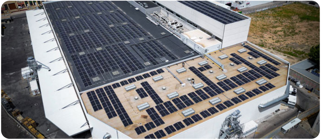
BAKQ - Álava