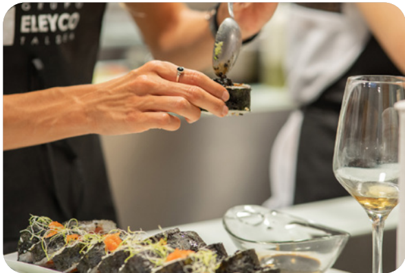
Cocina en familia