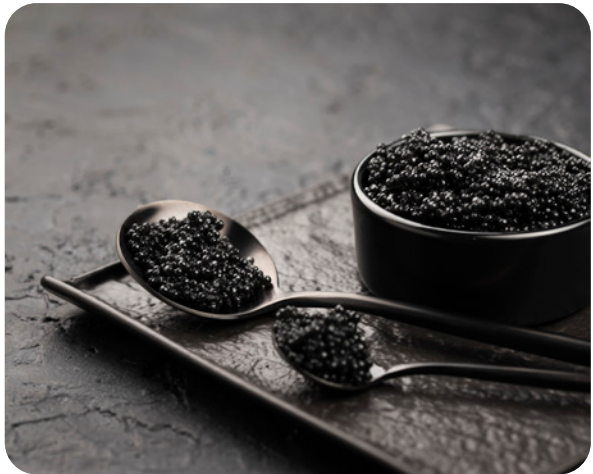
Productos de importación