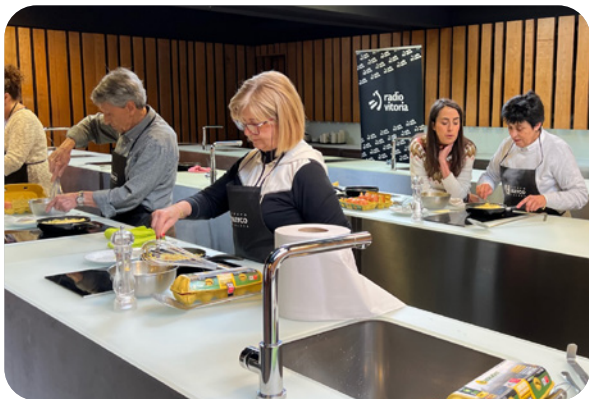
Cursos de cocina